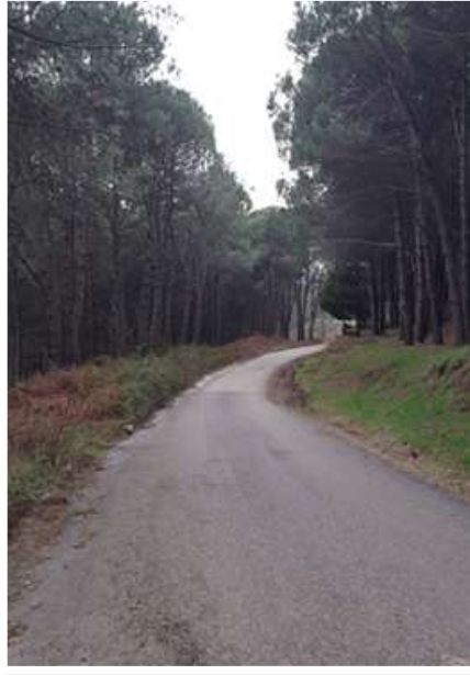
الشكل (2): منظر عام غابة الديدبان (نوفمبر 2022 م)

غابة طبيعية تكسوها أشجار السنديان Quercies والبَلوط Q. infectoria والسرو Cupressus بالإضافة لشجيرات العجرم Erica ، ارتفاعها حوالي 1000م عن سطح البحر تقدر مساحتها حوالي 4000 هكتار وهي مقسومة بواسطة طريق معبد إلى قسمين، طبيعة تربتها كلسية تكسوها طبقة من الدبال (الشكل 2).