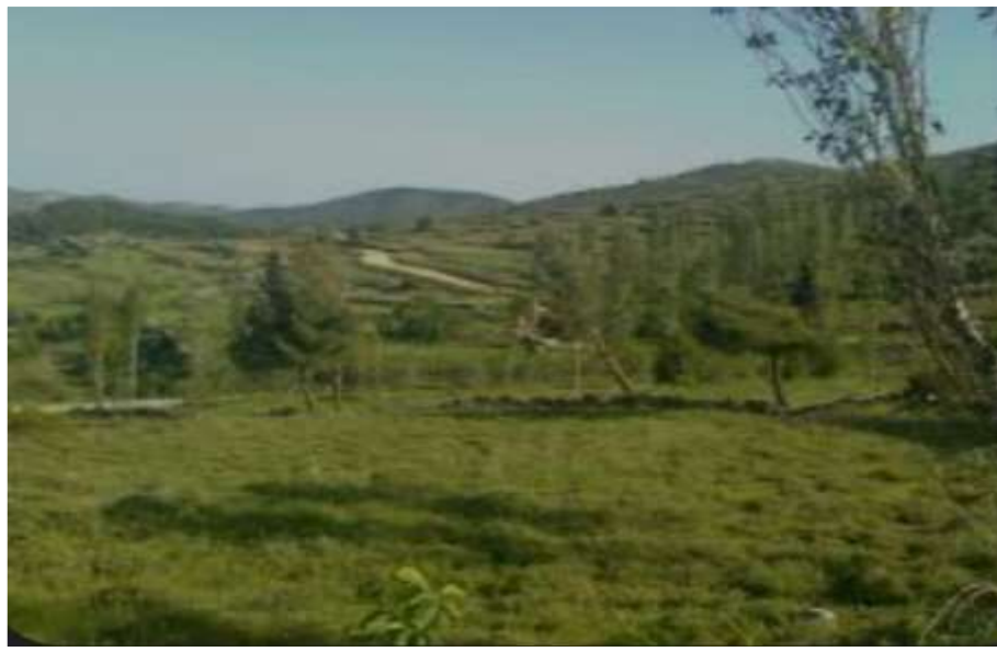
الشكل (3): منظر عام سهل البيرة (نوفمبر 2022 م)

يبلغ ارتفاعه 850 متراً عن سطح البحر، أرضه رطبة تُزرع بالقمح والشعير وبعض الأشجار المثمرة منها التفاح والكرز والتوت والكرمة، تبلغ مساحته 2500 هكتار (الشكل 3).