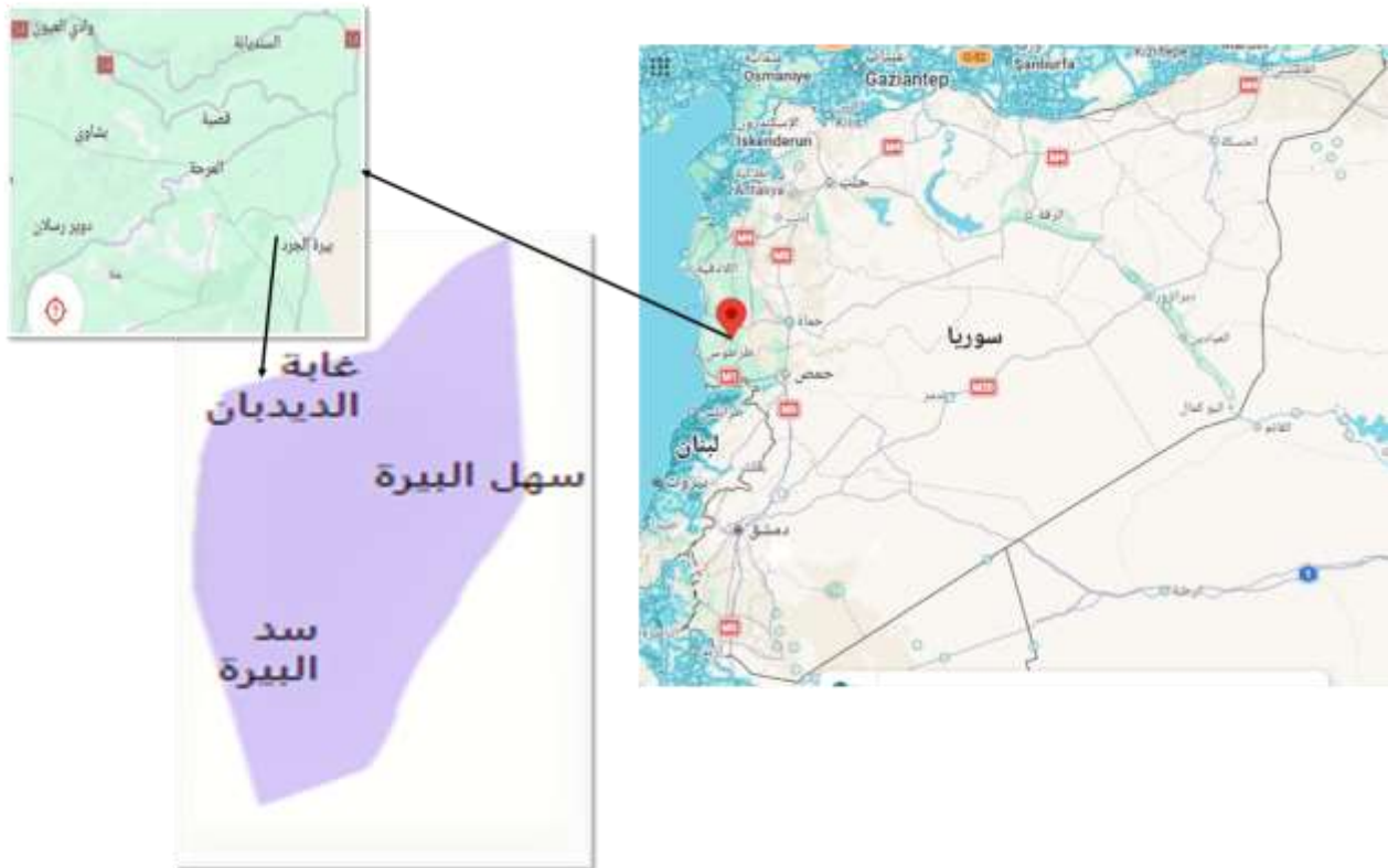
الشكل (1): منطقة الدراسة الواقعة في وادي العيون والتابع لمصياف بمحافظة حماة.

تقع منطقة وادي العيون على خط عرض 36,192^\circ وطول 42,271^\circ في الجبال الساحلية السورية باتجاه من الشرق إلى الغرب، يتكوّن الوادي من عدد من المسيلات المائية تتجمع لتشكل في النهاية نهر دائم الجريان (نهر الغمقة) الذي يصبّ شمال مدينة طرطوس. يحيط بالوادي جبال شديدة الانحدار تكسوها الغابات والأحراش وقسم منها أراضي زراعية. يبلغ متوسط ارتفاع الوادي عن سطح البحر 500 م وتصل قمة الجبال المحيطة به فوق 1200 م عن سطح البحر. يتبع إدارياً لمنطقة مصياف محافظة حماة حيث يبعد عن مصياف 18 كم وعن حماة 65 كم وعن طرطوس 43 كم (الشكل 1).