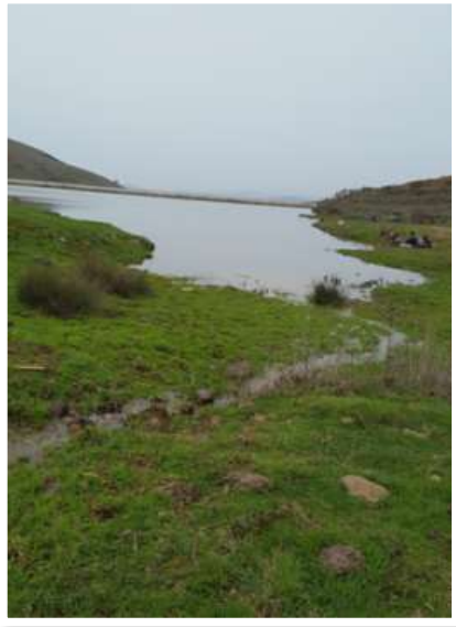
الشكل (4): منظر عام سدّ البيرة (نوفمبر 2022م)

يبلغ طوله 150 متر ومتوسط عمقه 15 متر، تبلغ سعته التخزينية 1000م 3 حديث التشكل ناتج عن تجمع مجاري أنهار وينابيع في منطقة جبل النبي متى المرتفع عن سطح البحر 1200 متر، مياهه باردة جداً شتاءً (-2) درجة مئوية ومعتدلة صيفاً 18 درجة مئوية، تحيط به نباتات عشبية وعدد من أشجار السرو، يُستخدم لريّ المزروعات (الشكل 4).