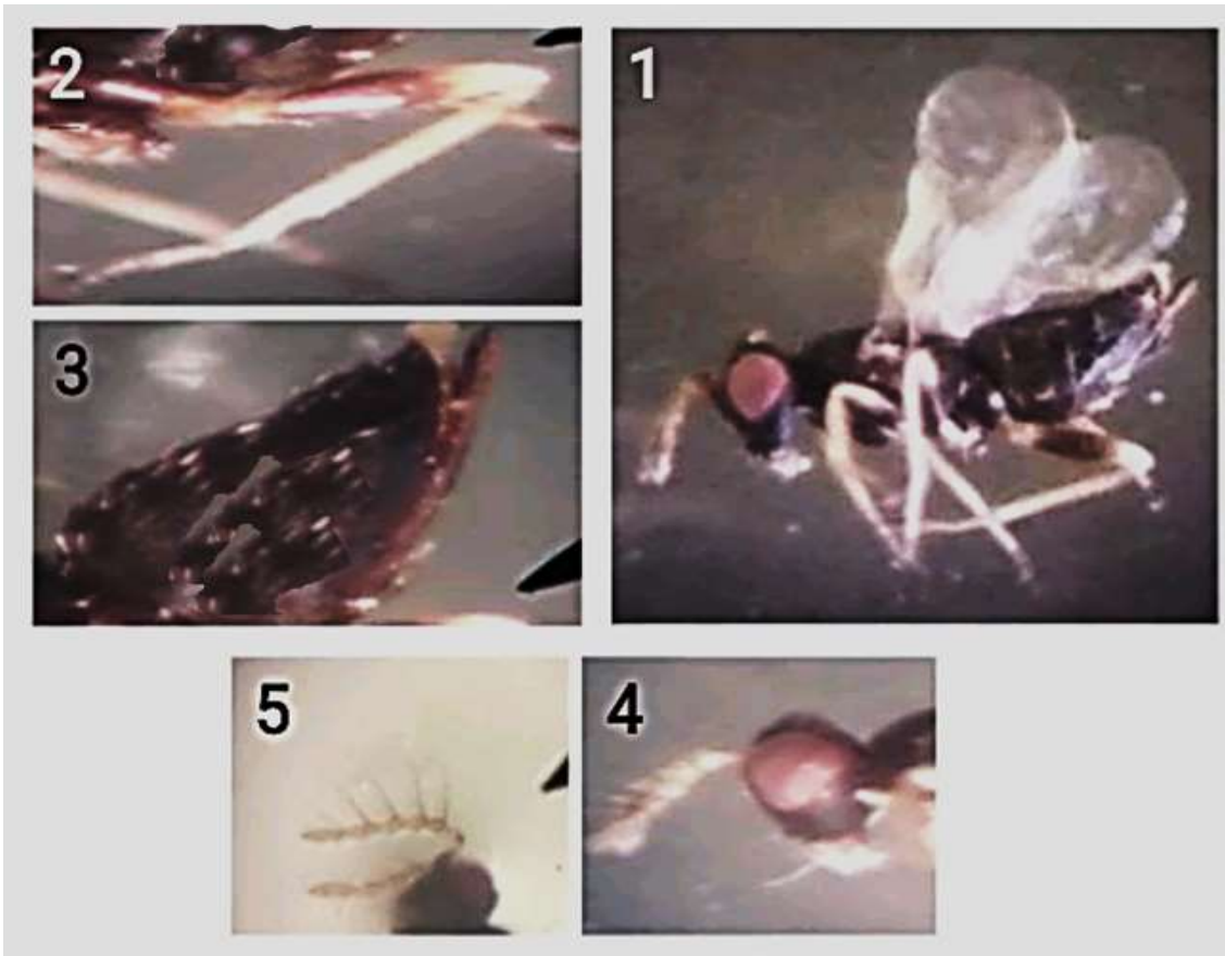
الشكل (2): تصوير الباحث الرئيسي المصنف للمتطفل": المتطفل Tamarixia radiata , (1): الحشرة الكاملة لأنثى المتطفل (2): الرجل الأمامية لأنثى المتطفل (3): آلة وضع البيض (4) قرون الاستشعار لأنثى المتطفل (5): قرون الاستشعار لذكر المتطفل.