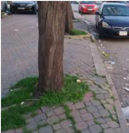
شكل 9: انضغاط الرصيف