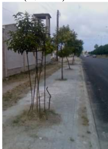
شكل 8: استخدام وسائل تدعيم خاطئة