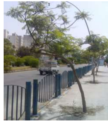
شكل 12: تشوهات النمو و التفرع