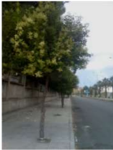
شكل 5: نقطة تفرع عالية (حالة صحيحة)