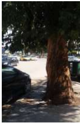
شكل 13: إعاقة الرؤيا للمارة