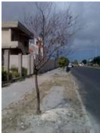
شكل 17: جفاف الشجرة