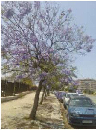
شكل 14 جكرندا مزهرة