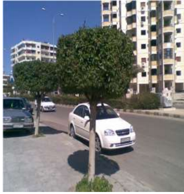
شكل 11: قص الأشجار بأشكال فنية