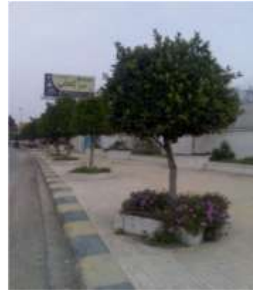
شكل 10: صف منتظم من أشجار التين اللامع