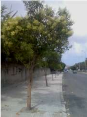
شكل 3: زراعة صف من أشجار اللينغستروم بجانب الطريق