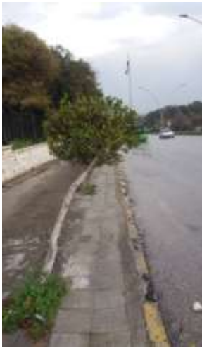
شكل 6: شجرة بساق منحنية نحو الشارع