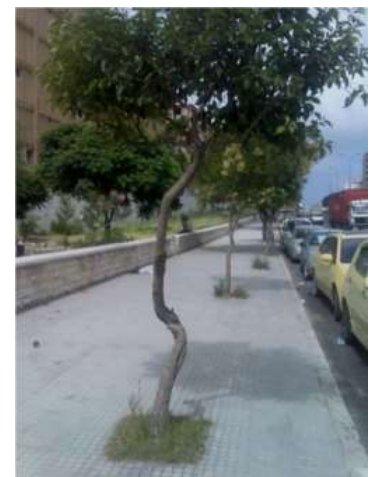
شكل 7: شجرة ذات ساق ملتوية