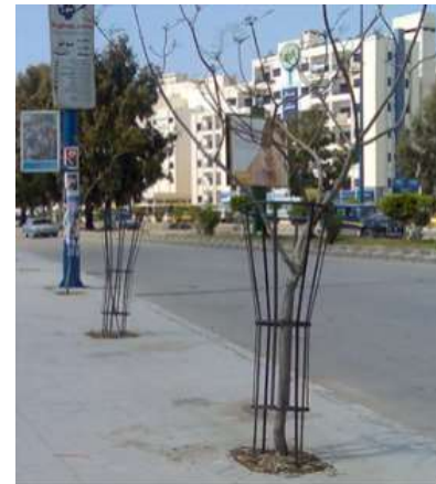
شكل 15: انخفاض نقطة تفرع الأغصان 3-5 العلاقة بين طول الشارع وعدد الأشجار

الجدول (3): الطول الإجمالي للمقاطع /م/ و عدد نقاط تشجير