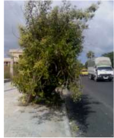
شكل 1: إهمال عمليات التربيبية و تقليم الأشجار