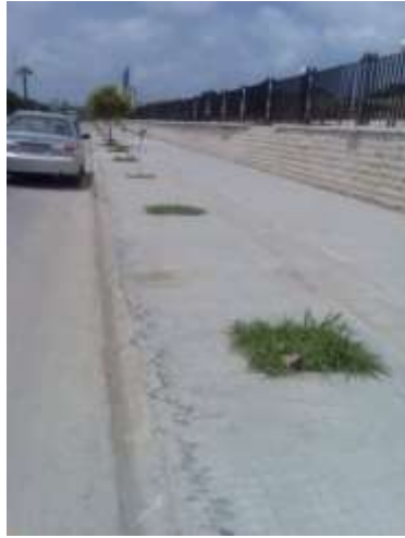
شكل 2: وجود مواقع غير مشجرة على الرصيف