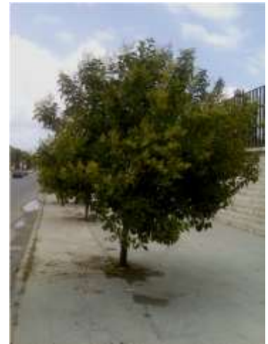
شكل 4: انخفاض نقطة تفرع الأغصان (حالة خاطئة)