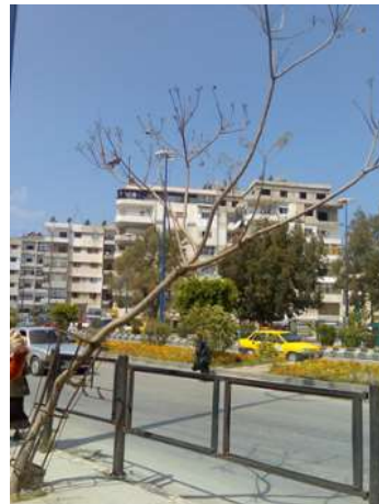
شكل 16: وسائل تدعيم خاطئة